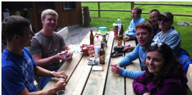
Auch Jassen gehört zu den Sommersportarten!