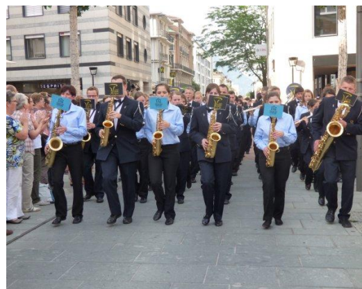
Feldmusik und Jugendmusik gemeinsam unterwegs!

Am Samstag, 7. Juni ging es los. Nach der langen Carfahrt standen zunächst die Wettbewerbsvorträge auf dem Programm, sie gelangen uns und der Jugendmusik hervorragend. Wir erspielten uns die höchste Punktzahl, ein super Resultat! Nach dem Gesamtchor wartete der nächste Höhepunkt mit der gemeinsamen Marschmusik auf uns. Mit gegen 100 Musikern marschiereten wir zur Freude der Zuschauer durch die Innenstadt. Der Abend gehörte der Pflege der Kameradschaft und dem Fest. Die nächsten zwei Tage verbrachten wir in Martigny und Umgebung, mit viel Kultur, Wein und gutem Essen. Der Ausflug war für uns wie auch für die Jugendmusik ein voller Erfolg!